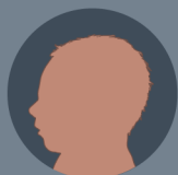
Tamaño normal de la cabeza

Usted puede transmitir el zika durante el embarazo.