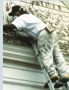
由外面帶回家的鉛 (職業或嗜好)