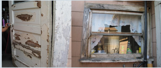
建於1978年以前的住宅 油漆問題