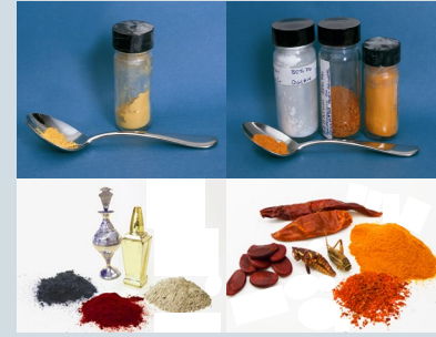
傳統的民間醫藥、化妝品 和化妝粉