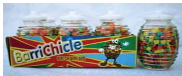
BarriChicle Chewing Gum Recalled: 3/10/08