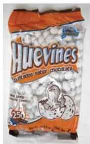
Huevines Confitados Sabor Chocolate Retirado: 7/31/08