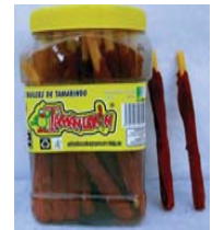
Tamanlorin/Paleta de Tamarindo Retirado: 3/10/08