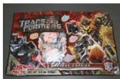
Transformers Revenge of the Fallen Crunchy Candies***** Recalled: 8/6/10