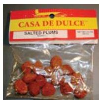
Casa De Dulce Salted Plums Chile Retirado: 10/29/10