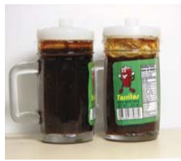
Tarritos, Dulce líquido Retirado: 2/6/08