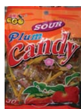
Ego Sour Plum Candy de Malaysia Retirado: 11/3/10