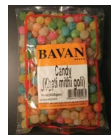
BAVAN Santra Goli Recalled: 1/28/11