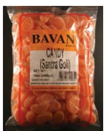
BAVAN Khati Mithi Goli Recalled: 1/28/10

For questions or more information, please contact the Los Angeles County Department of Public Health: