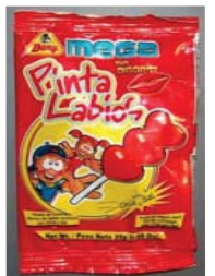
Dulces Beny Mega Pinta Labios***** Recalled: 6/11/09