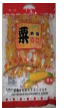
Corn Jelly Choice American Sweet Corn Flavour Recalled: 5/4/10