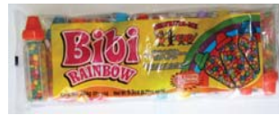
Bibi Rainbow Chewing Gum Recalled: 2/6/08