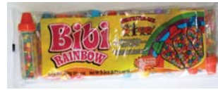
Bibi Rainbow Chicle Retirado: 2/6/08