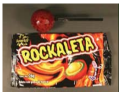
Sonic's Rockaleta with Chili and Mango Flavored Gum Center****