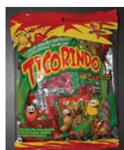
Dulces Ticolorindo Retirado: 12/31/09