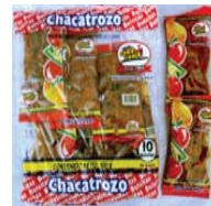
Chaca Chaca Chacatrozo Recalled: 4/11/08