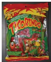
Ticorindo candy Recalled: 12/31/09