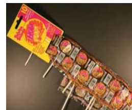
Hola Pop La Original Lollipop Candy Recalled: 5/2/09