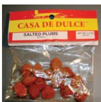
Casa De Dulce Salted Plums w/Chile Recalled: 10/29/10