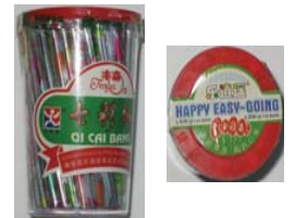
Qi Cai Bang Retirado: 6/18/08