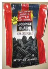
Lucky Country AUSSIE STYLE Soft Gourmet Licorice Black (All Natural)*** Recalled: 8/21/08