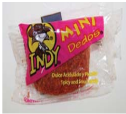
Indy Mini Dedos, Picante y Agrio Retirado: 1/18/08

Ultima Fecha de Actualización: enero 28, 2011**