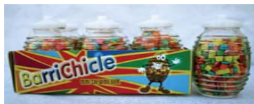
Chicle BarriChicle Retirado: 3/10/08