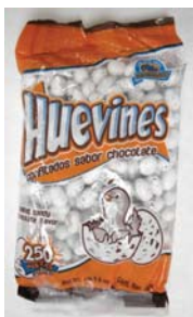
Huevines Confitados Sabor Chocolate Recalled: 7/31/08