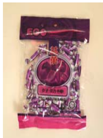
Ego Hao Jin Bang Retirado: 7/31/08