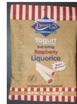
Australia's Darrell Lea Yogurt Coated Soft Eating Raspberry Liquorice Recalled: 3/17/10