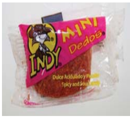
Indy Mini Dedos, Spicy & Sour Recalled: 1/18/08