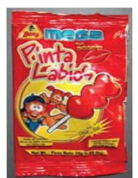
Dulces Beny Mega Pinta Labios**** Retirado: 6/11/09