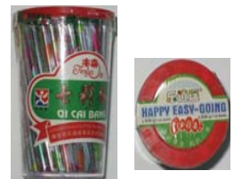
Qi Cai Bang Recalled: 6/18/08