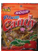
Ego Sour Plum Candy from Malaysia Recalled: 11/3/10