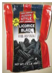
Lucky Country AUSSIE STYLE Soft Gourmet Licorice Black (All Natural)*** Retirado: 8/21/08