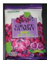
Cocon® Grape Gummy 100% Candy Recalled: 8/27/10