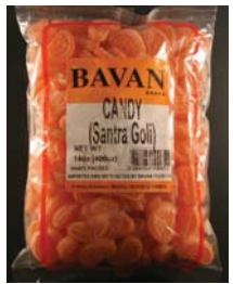
BAVAN Khathi Mithi Goli Retirado: 1/28/10

Para preguntas o más información favor de ponerse en contacto con el Departamento de Salud Pública del Condado de Los Angeles: