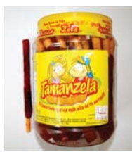
Tamanzela, Paleta cubierta con chile Retirado: 2/6/08