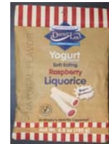
Australia's Darrell Lea Yogurt Coated Soft Eating Raspberry Liquorice Retirado: 3/17/10