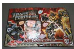
Transformers Revenge of the Fallen Crunchy Candies***** Retirado: 8/6/10