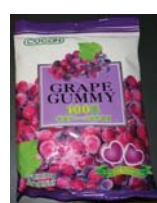
Cocon® Grape Gummy 100% Candy Retirado: 8/27/10