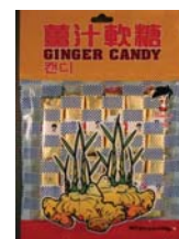
DaiJyo Bu Ginger Candy de China Retirado: 9/21/10