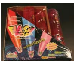
Flash Pop Candy Retirado: 6/25/10