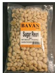
BAVAN Brand Sugar Reori Retirado: 12/29/10