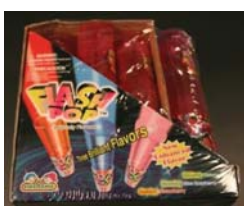
Flash Pop Candy by Kidsmania Recalled: 6/25/10