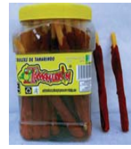
Tamanlorin/Tamarind Lollipop Recalled: 3/10/08