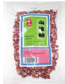
Hawthorn Candy Retirado: 10/3/08