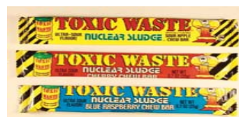
"Toxic Waste" brand "Nuclear Sludge Chew Bar" candy from Pakistan Recalled: 1/14/11