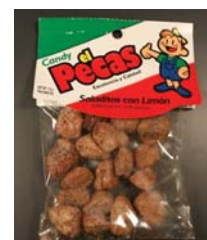
Limón Candy el Pecos Recalled: 10/14/10