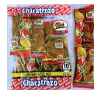
Chaca Chaca Chacatrozo Retirado: 4/11/08