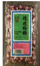
SENG Chen PiMei Candy Recalled: 6/5/09