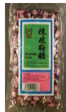
SENG Chen PiMei Candy Retirado: 6/5/09