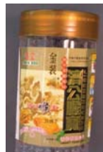
Jigong Chayote Retirado: 10/23/09