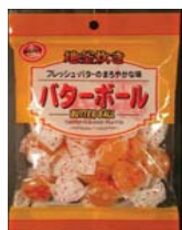
Butter Ball Candy Recalled: 12/13/10