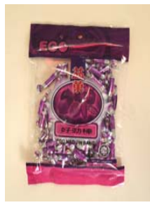
Ego Hao Jin Bang Recalled: 7/31/08