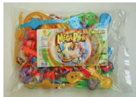
Old Label Dulces Yosi Mega Pack Toys with Gum Recalled 3/26/08