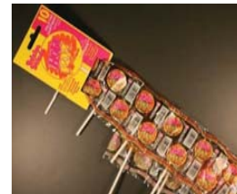
Hola Pop La Original paleta de dulce Retirado: 5/2/09