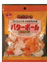
Butter Ball Candy Retirado: 12/13/10