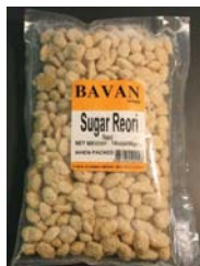
BAVAN Brand Sugar Reori Recalled: 12/29/10