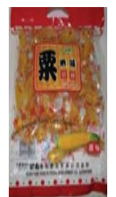
Corn Jelly Choice American Sweet Corn Flavour Retirado: 5/4/10