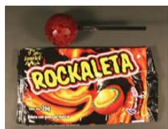
Sonics Rockaleta con Chili y Chicle de sabor a Mango en el Centro****